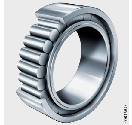
Resim 3 - FAG-Silindirik makaralı rulman, sık dizili